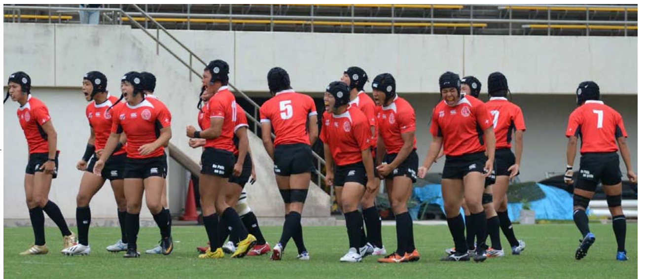
県大会決勝で惜敗したものの、東海総体ではブロック優勝を果たしたラグビー部-瑞穂公園ラグビー場で