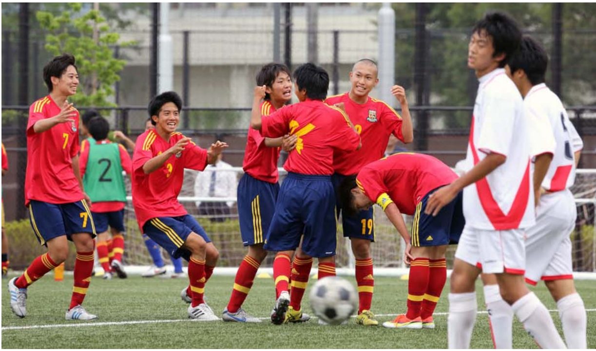
高校総体県大会で悲願の初優勝を決めたサッカー部 柳瀬公園サッカー場で